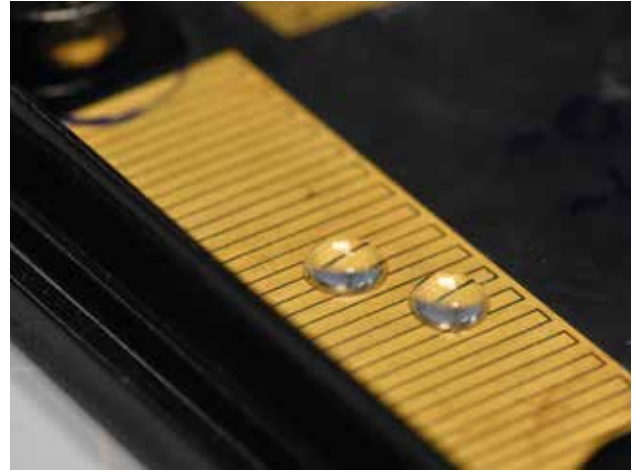
03 Flexible Leiterplatten und Sensoren können in dreidimensionale Gehäuse integriert werden

Verfahren ist bewährt. Da jedoch der Kunststoff-Spritzguss die Grundlage bildet, lässt er sich bei kleineren Serien oder gar bei Unikaten nicht wirtschaftlich anwenden.