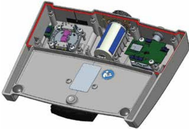
02 Eine ins Gehäuse integrierte Feuchtemessung ist eine sinnvolle Option für Fußschalter im OP – und ein Untersuchungsgegenstand des Merlin-Projekts von it’s OWL